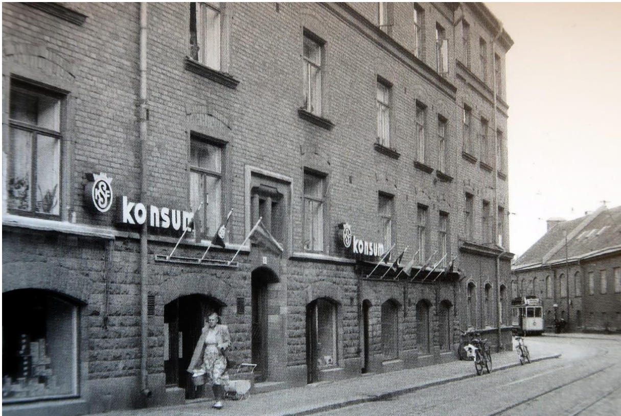
Danviksgatan vid stearinfabriken ...